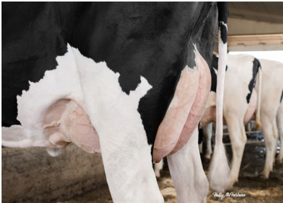
PROGENESIS FORTUNE PALAU DAM